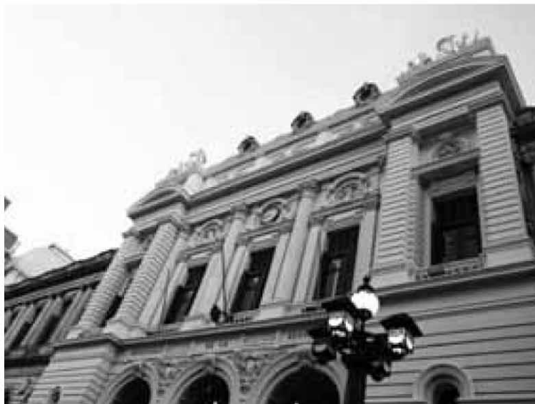
La matrícula de la Udelar descendió en los últimos años. N. GARRIDO

En la presentación, Grünberg afirmó también que entre 1990 y