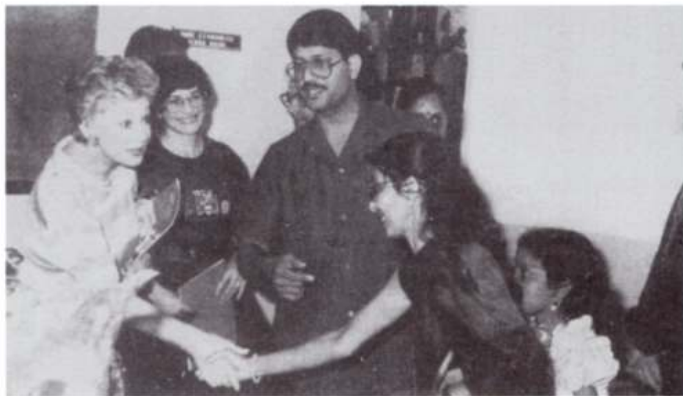
Ceremonia de entrega de diplomas, Bombay, India