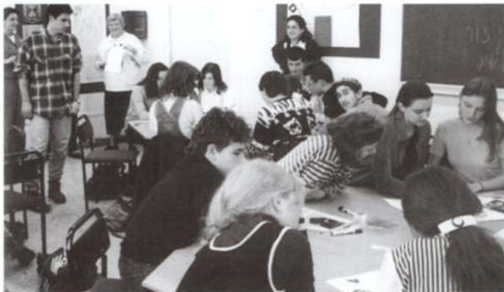
Clases de hebreo en ORT Moscú (1995)