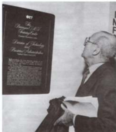
Inauguración del Centro Bramson en la ciudad de Nueva York, 6 de setiembre de 1977.