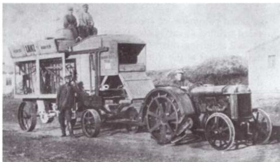
Cooperativa agrícola "Primavera", bajo el régimen soviético, Ucrania, 1927.