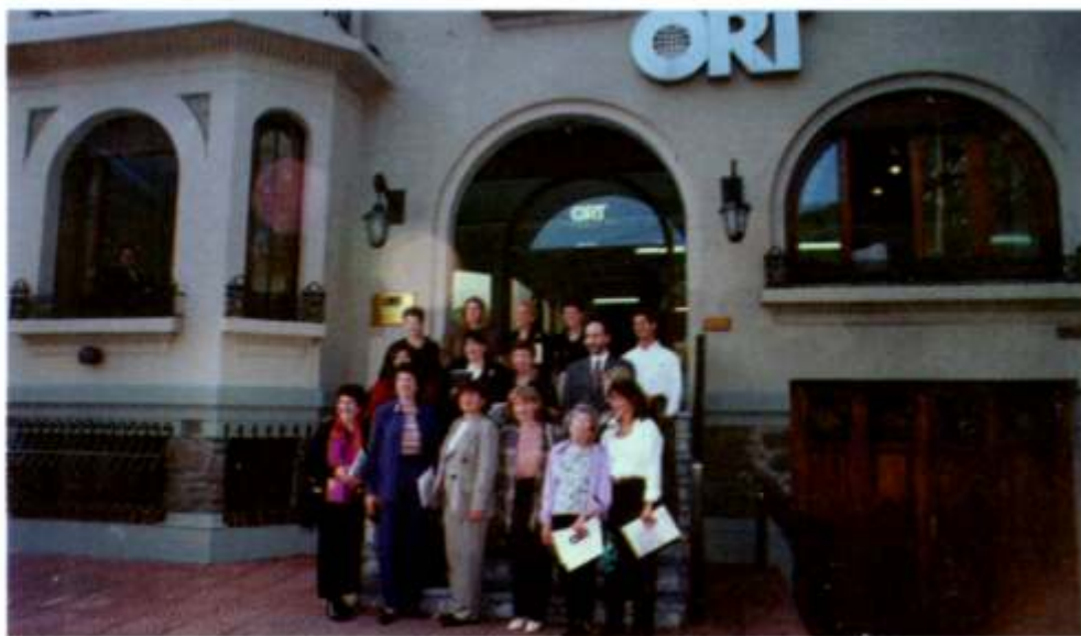
Delegación de WAO en ORT Uruguay, mayo de 1999