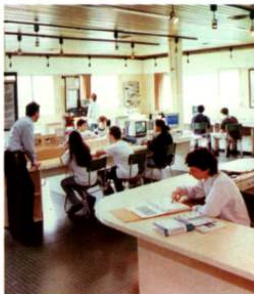
Biblioteca de ORT Argentina, Buenos Aires, 1987