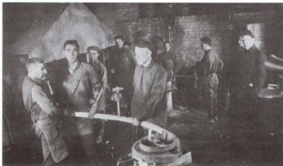
Taller de herrería en alguna parte de Europa Oriental, después de la Primera Guerra Mundial.