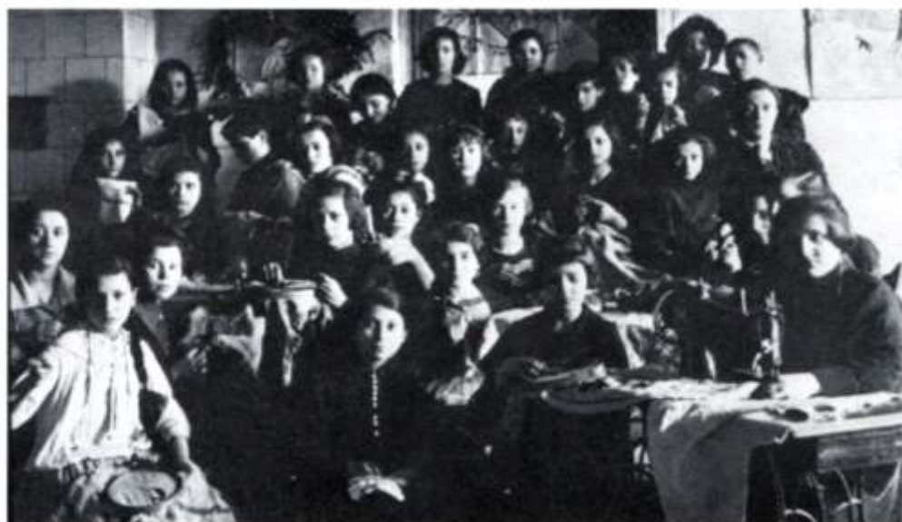
Taller de costura en Varsovia