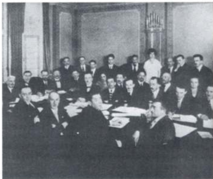
Asamblea fundacional de ORT Union, Berlin, 1921