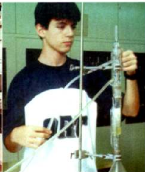
Laboratorio de biotecnología en ORT Brasil, 1987