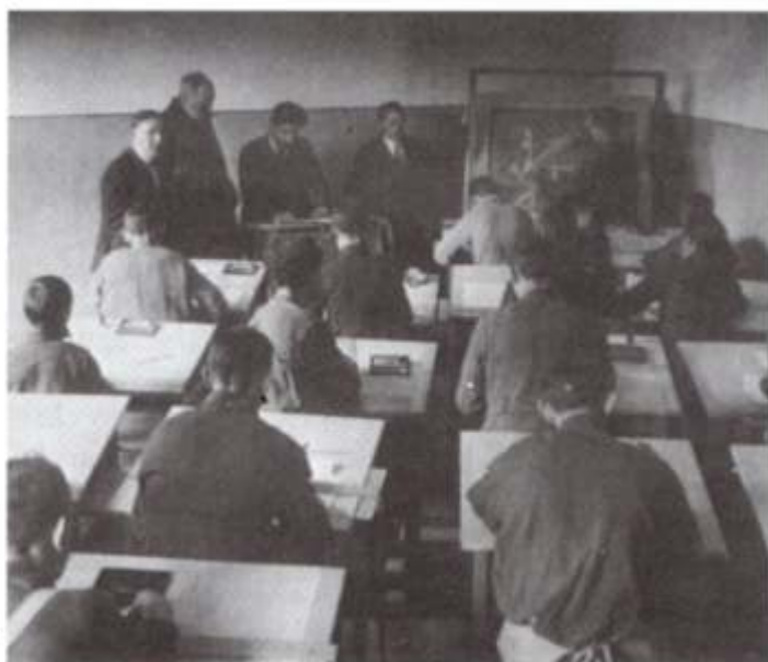
Clase de diseño mobiliario en Kishinev, 1929