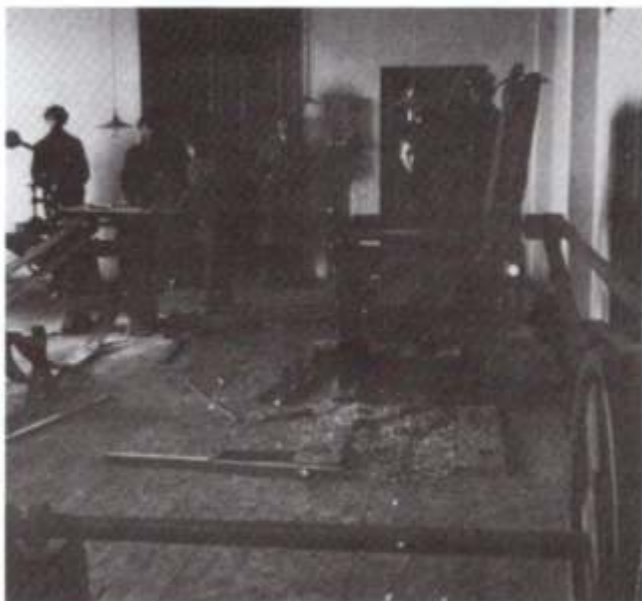
Taller en Dvinsk, con máquinas a correa.