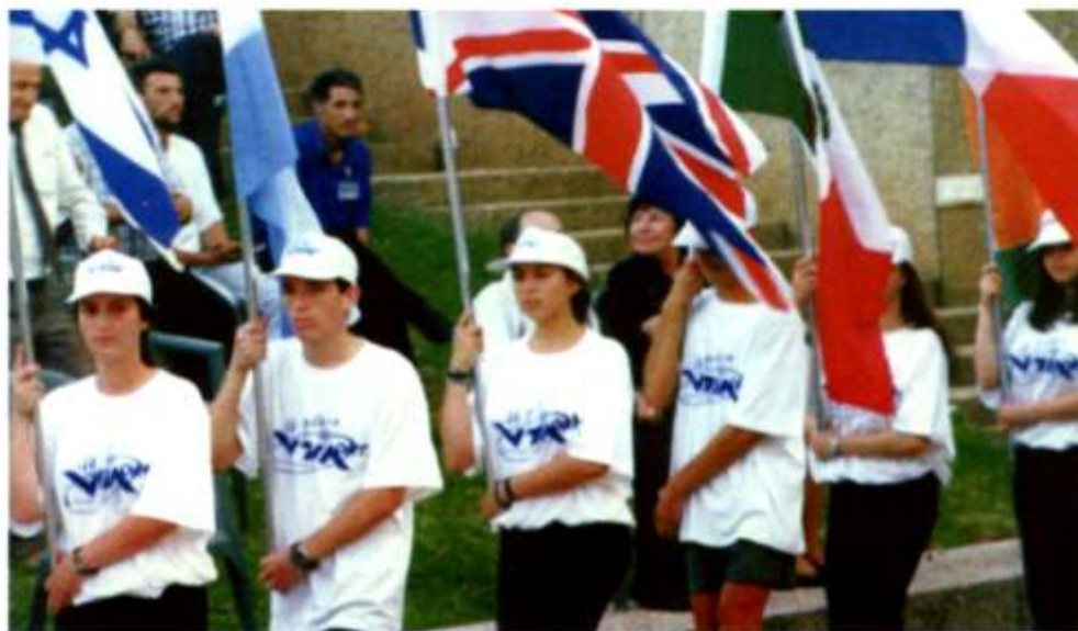
Ceremonia de clausura del International Principals Meeting en ORT Israel, 1998