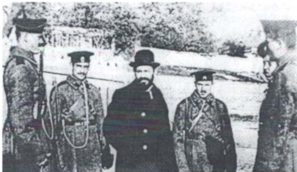
Menahem Mendel Beilis, acusado de crimen ritual, Kiev, 1913.