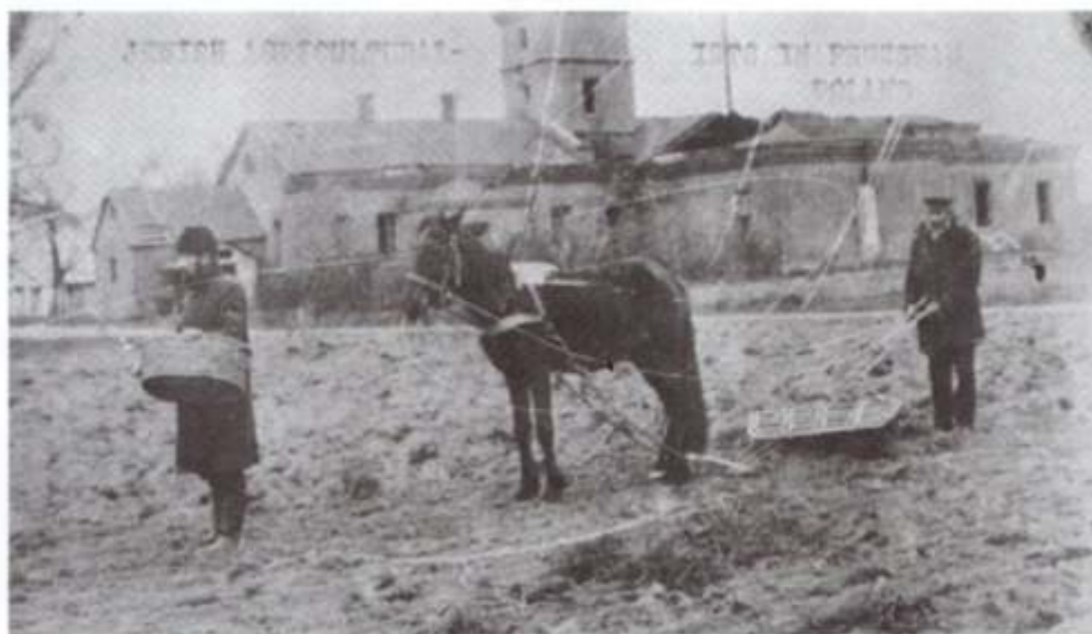
Campesinos judíos en la región de Grodno, Polonia, después de la Primera Guerra Mundial.