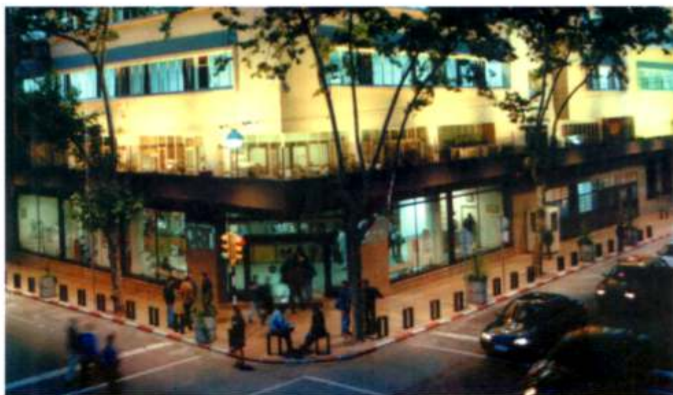
Facultad de Ingeniería "Bernard Wand-Polak" en la Universidad ORT Uruguay, 1999.