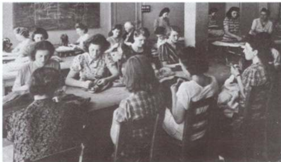
Taller de diseño de vestimenta en Perigueux, Francia, 1942.