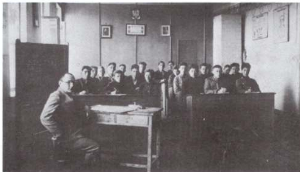
Dictado de clase en una escuela ORT de Brest-Litovsk, 1925