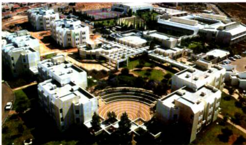
ORT Karmiel (Braude) en Israel.