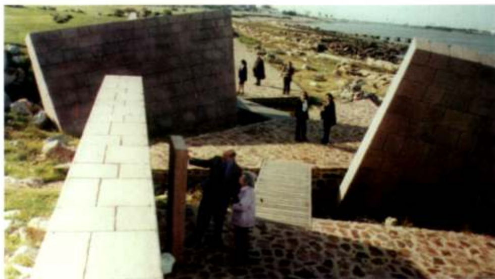
Monumento al Holocausto en Montevideo, República Oriental del Uruguay. Este es uno de lo pocos recordatorios del Holocausto en Latinoamérica.