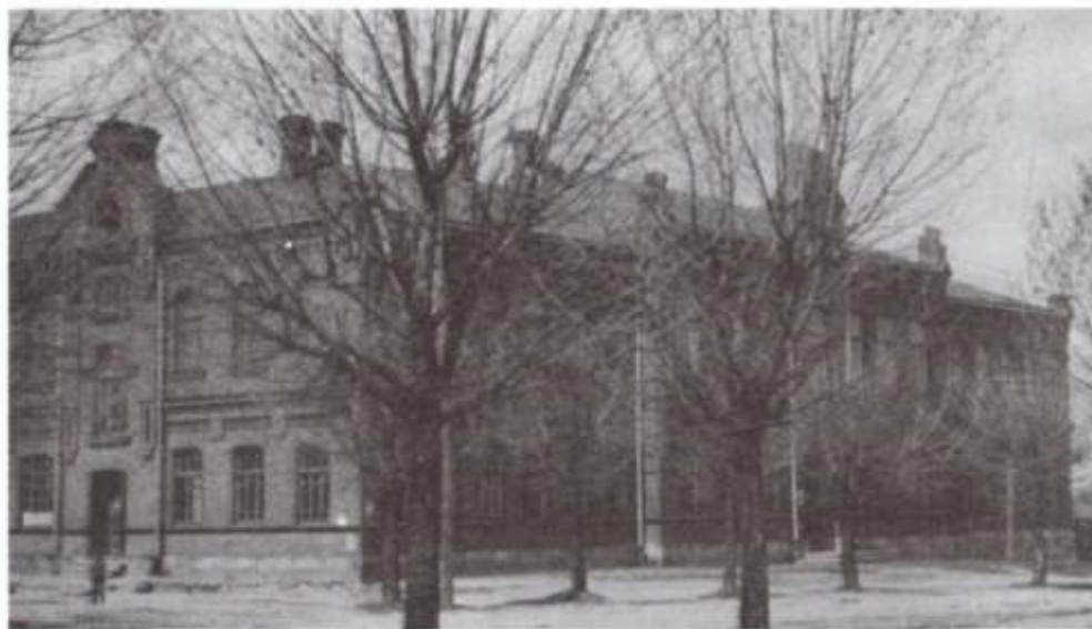
Vista exterior de la escuela de Dvinsk antes de la Primera Guerra Mundial