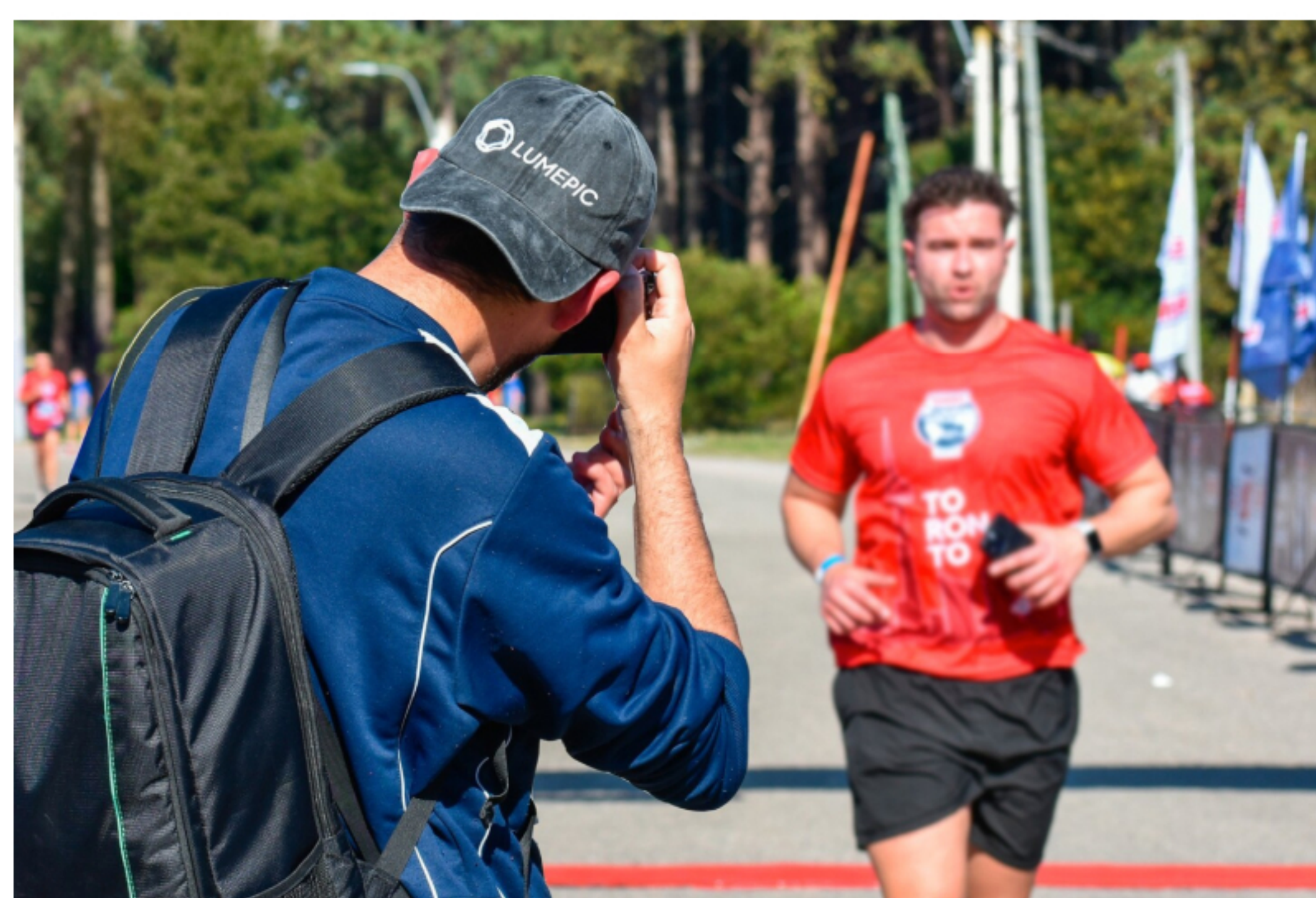
Lumepic. La startup busca captar nuevos mercados.